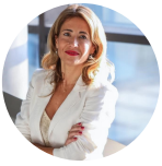
Raquel Sánchez Jiménez

Spaans ministerie van vervoer, mobiliteit en stedelijke agenda