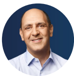
Manuel Pizarro Europees Parlement

"Het feit dat er extreme armoede bestaat zou topprioriteit moeten zijn voor de EU. Het is in feite onrechtmatig, op basis van artikel 3 van het Verdrag van de Europese Unie. Het is onze plicht om sociale uitsluiting te bestrijden. We kunnen anderen niet verwijten dat ze zich niet aan de regels houden als we niet eens onze eigen fundamentele regels volgen.